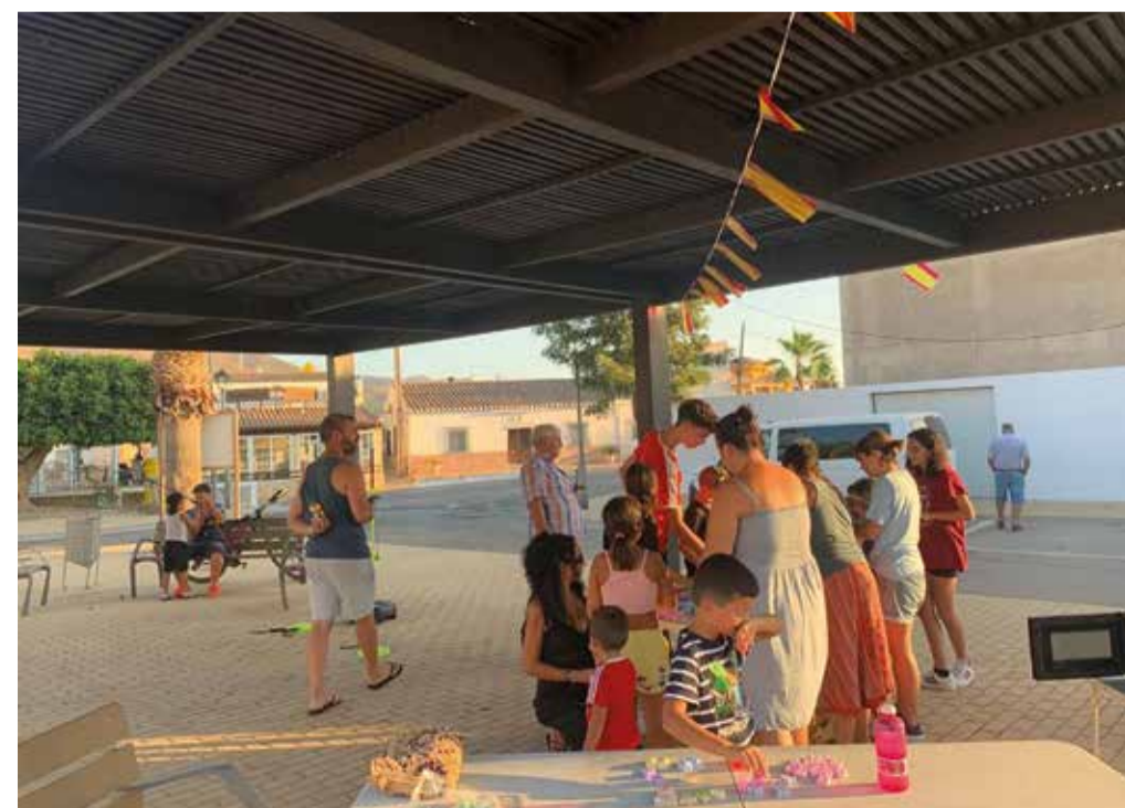
Taller de jabón para los peques y no tan peques