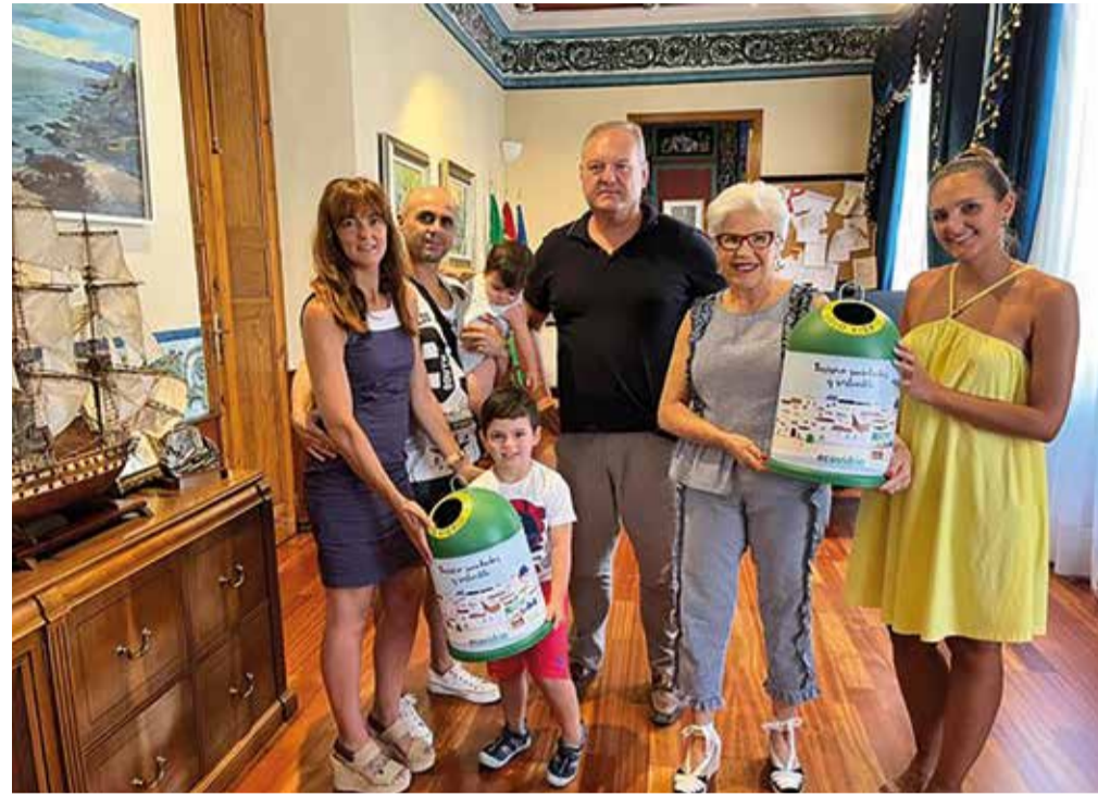
Concurso de Miniglús con la campaña de Ecovidrio