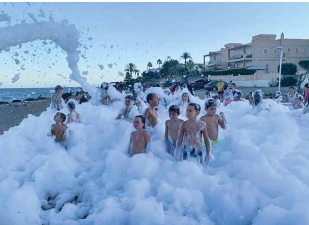
Fiestas del Agua y de la Espuma en las barriadas