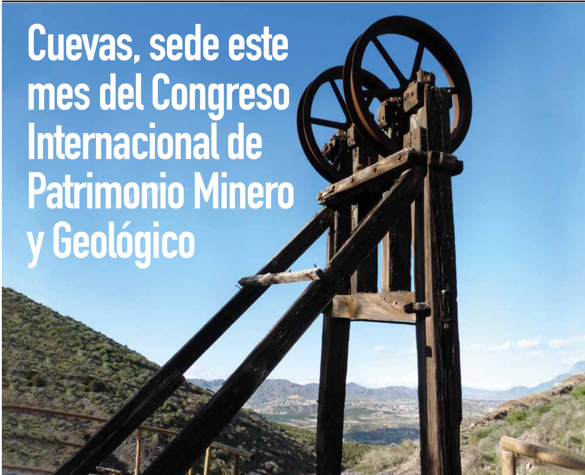
La máquina de vapor del barranco El Chaparral en Sierra Almagrera es la más antigua conservada en Andalucía con estas características y con dedicación a la minería, y por extensión una de las más antiguas de España

Del 29 al 2 de octubre el patrimonio cuevano estará en el centro del evento que organiza la Sociedad en Defensa del Patrimonio Minero y Geológico. PÁG 2