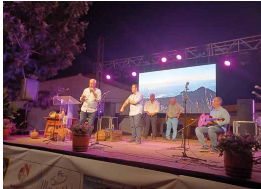
Festival Trovero en Los Lobos con la Asociación Trovera José Travel Montoya El Repuntin