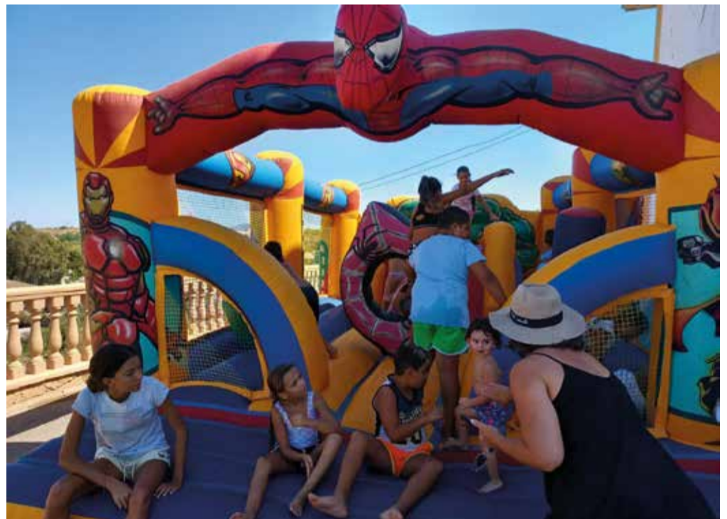
Fiesta de hinchables y espuma