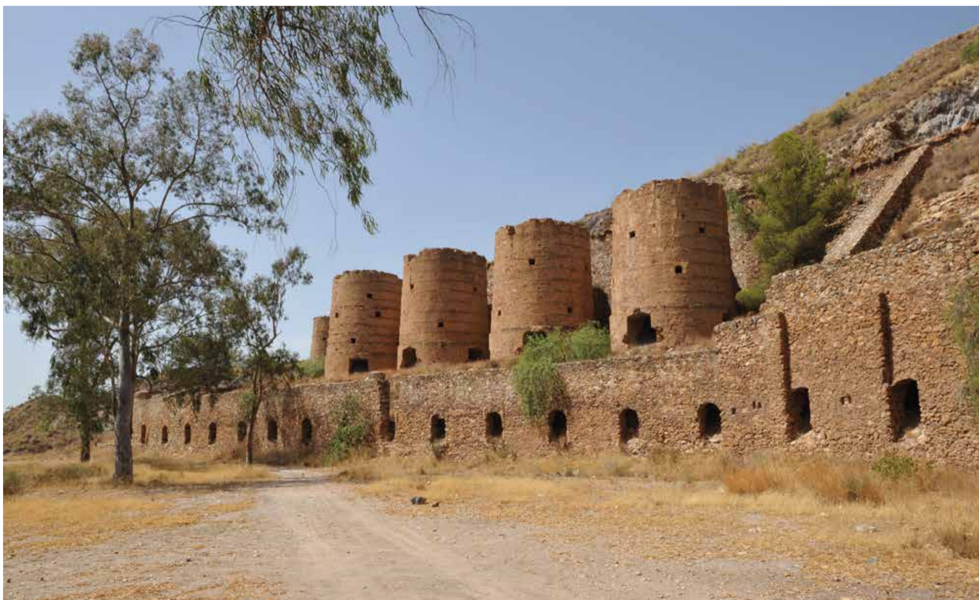
Mina de los Tres Pacos

conferencias y comunicaciones, o por algunos de los actos y actividades programadas, podrán asistir siempre que el aforo lo permita.