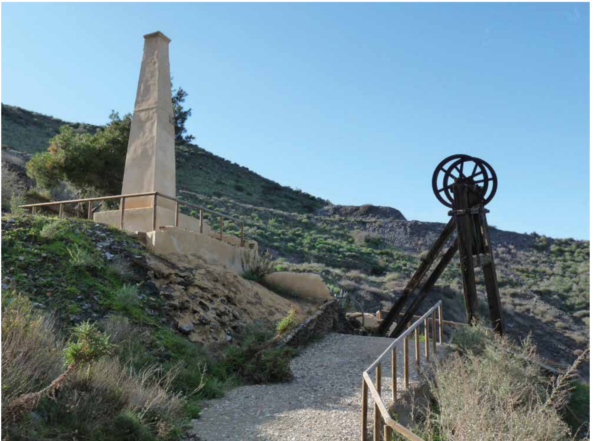
Máquina de Vapor de mina Encantada o Loba

EL MUNICIPIO ACOGERÁ ENTRE EL 29 DE SEPTIEMBRE Y EL 2 DE OCTUBRE EL XIX CONGRESO INTERNACIONAL SOBRE PATRIMONIO GEOLÓGICO Y MINERO