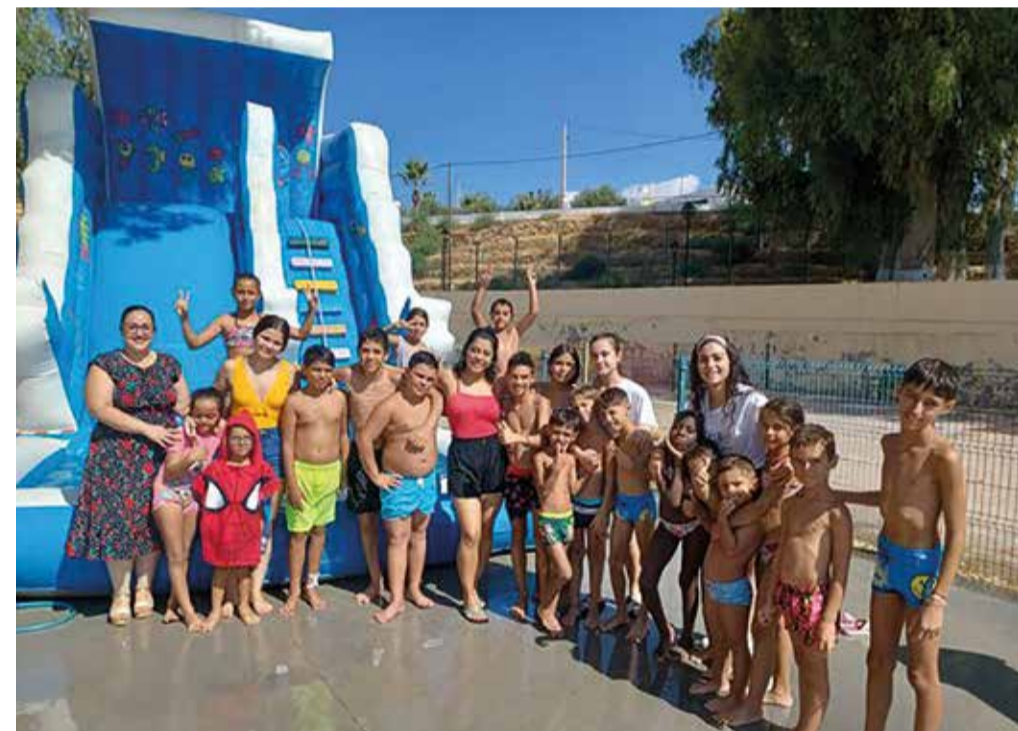
Escuela de Verano en el cole Virgen del Carmen