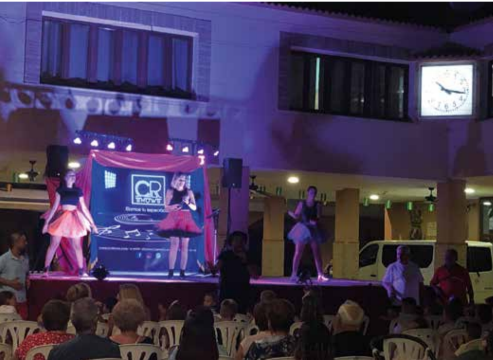
Espectáculo infantil 'Tiempo de fantasía' en Palomares