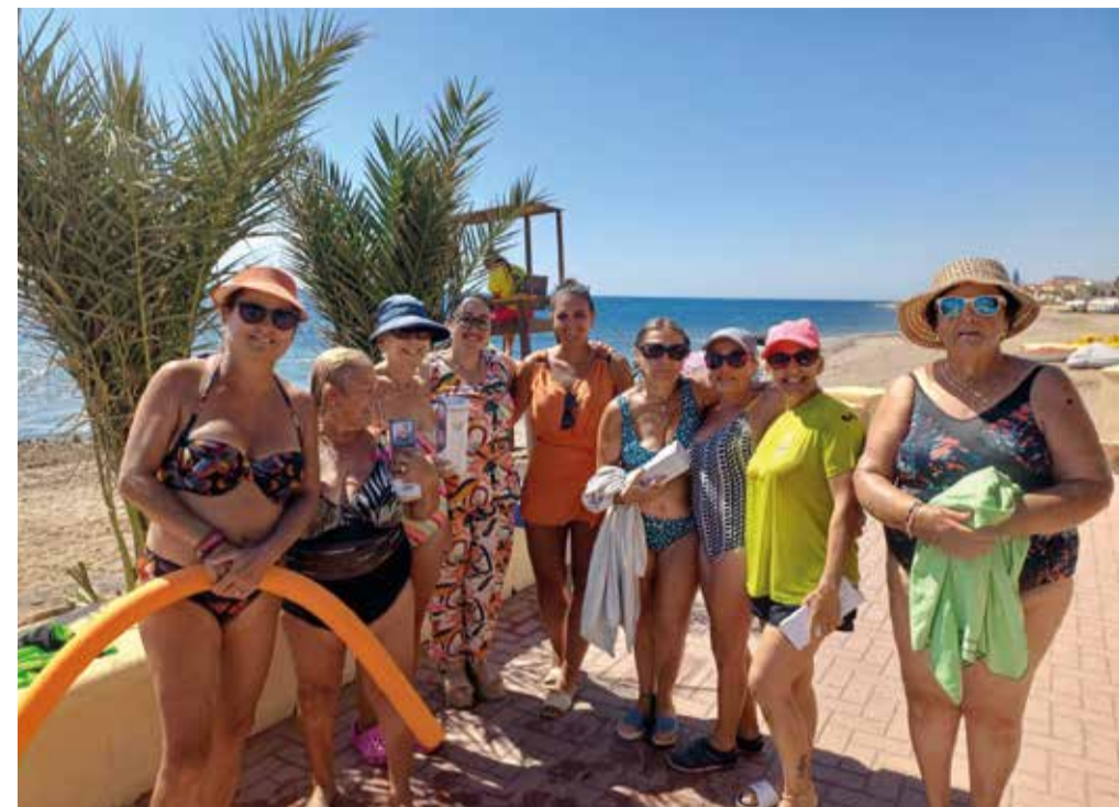
Clausura del Aquagym en Pozo del Esparto