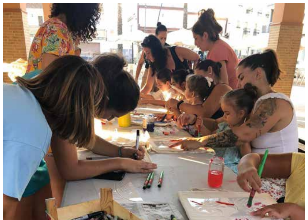
Taller de pintura y bolsos