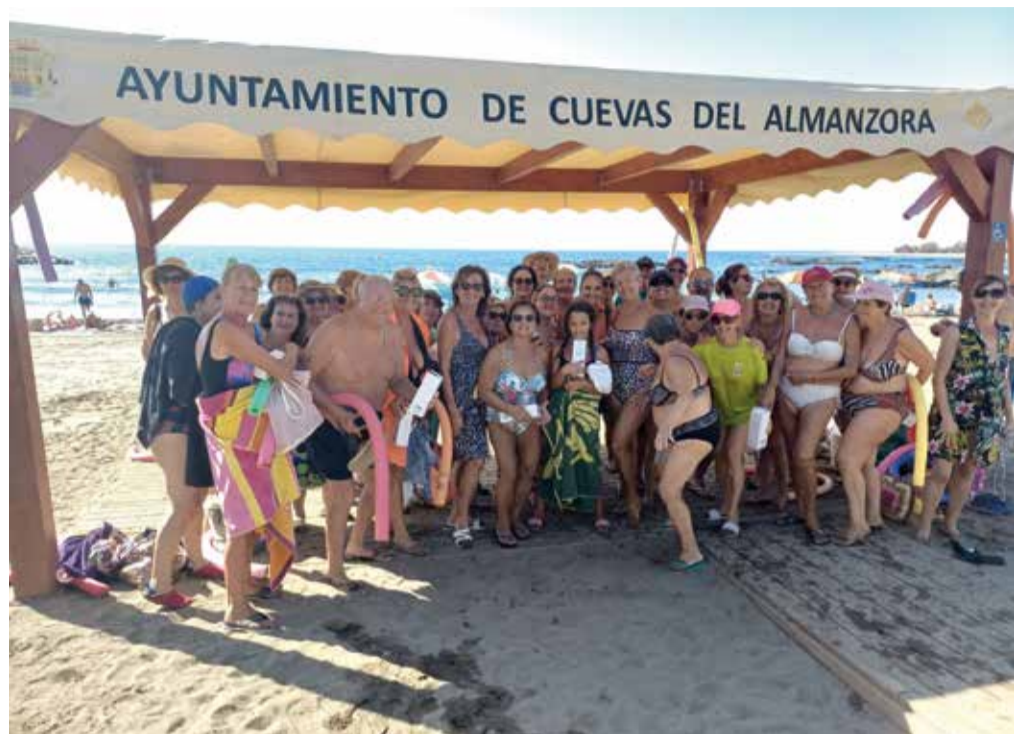
Clausura del Aquagym en Villaricos