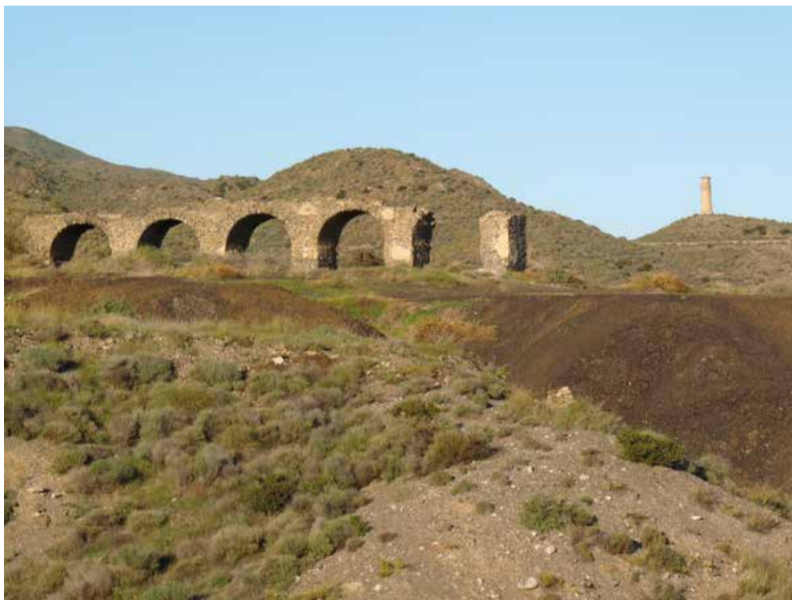
Fundición La Invencible

Esta cita congresual, tan necesaria para descubrir y promover nuestra riqueza geológica y minera, pretende constituirse en un dinámico foro de debate propicio para que sus participantes intercambien conocimientos y experiencias. Sin sacrificar rigor, quiere desembarazarse de los corsés que en ocasiones imponen los congresos académicos, penetrando en la sociedad y haciéndola partícipe de las finalidades que un encuentro de estas características debe perseguir: conocer, conservar, poner en valor y difundir nuestro