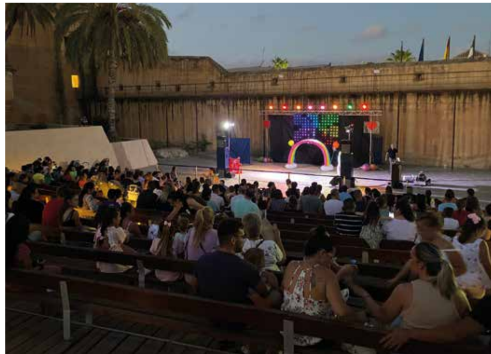
Musical Divertilandia en el Castillo de Cuevas del Almanzora